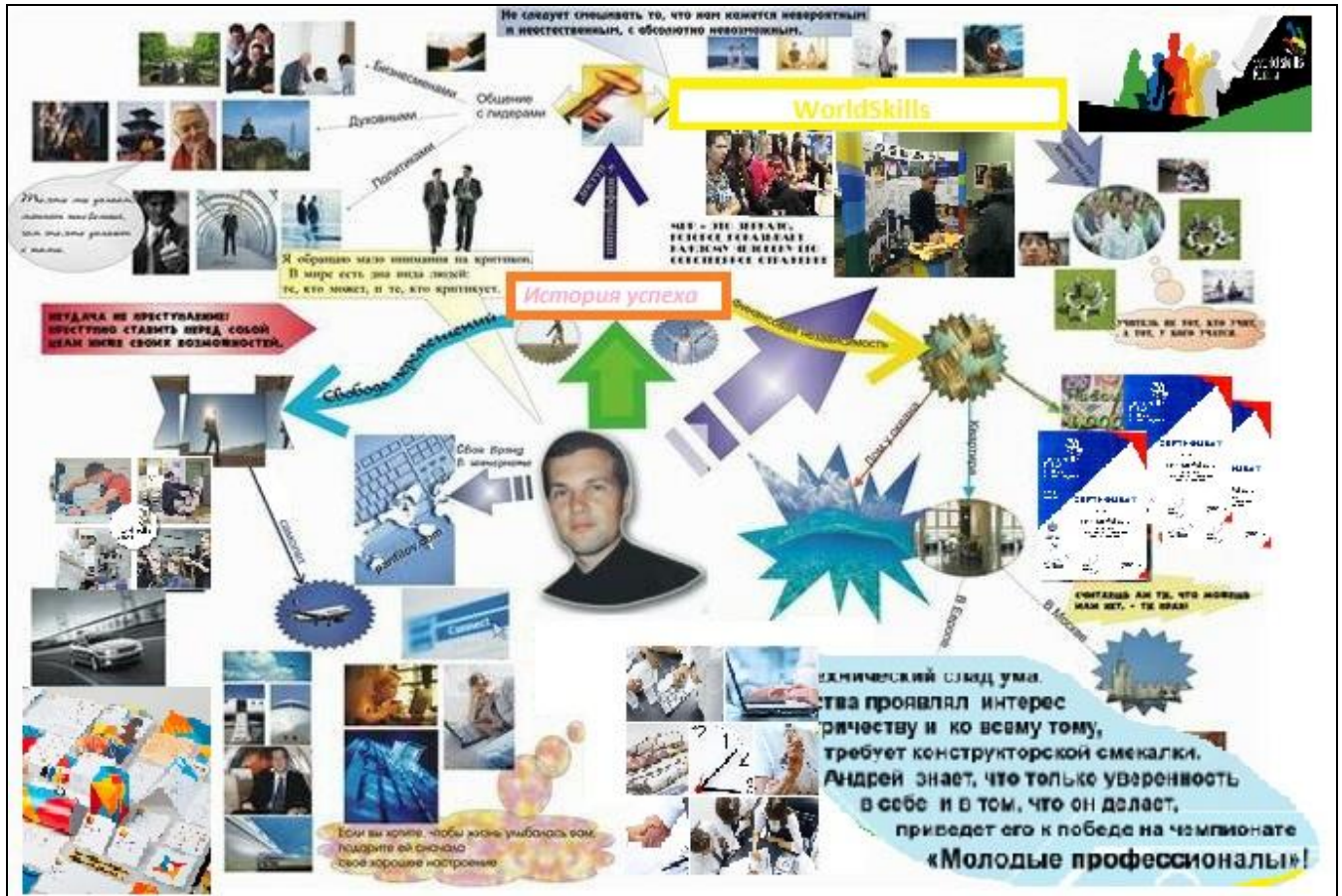
Пример оформления коллажа